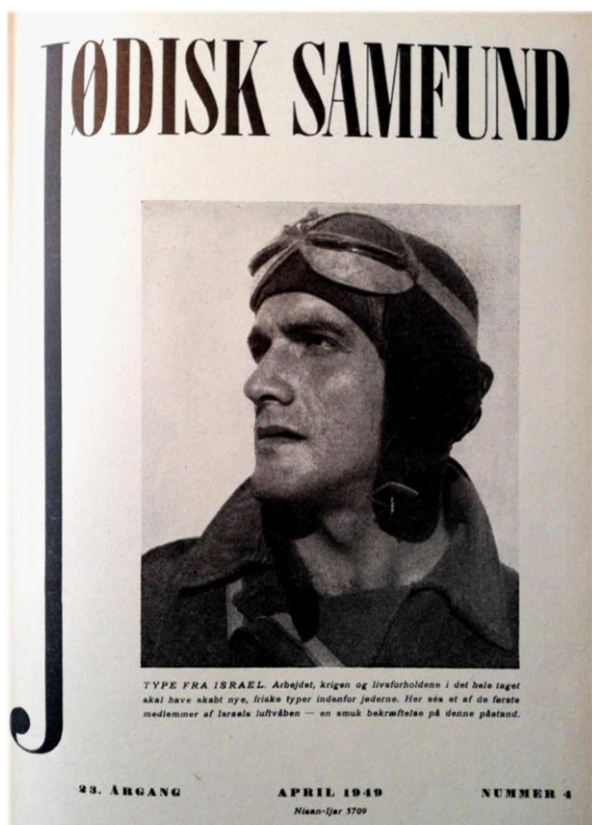
Figur 3: Jødisk Samfunds forside fra april 1949.

Nedenfor er der bragt to forsidebilleder fra JS. Fra 1949 blev magasinet layout opdateret, og den tidligere blanke forside blev derefter prydet med billeder. Det er i sig selv sigende for den dansk-jødiske opmærksomhed mod Israel, at størstedelen af disse forsidebilleder i specialets tidsperiode, var fotografier fra netop Israel. Den nyligt oprettede jødiske stat blev altså også visuelt præsenteret – og det endda på forsiden i størstedelen af tilfældene. Nedenstående forsider fremhæves her, da de sætter rammen for den pointe, som dette kapitel koncentrerer sig om; at staten Israels oprettelse resulterede i en ny fortælling om jøder – en fortælling, som fik identitetsmæssig betydning for jøder i Danmark.