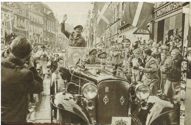
Montgomery kører gennem Strøget i København, 1945.

Fredag den 4. maj 1945 kl. 20.35 meddeler BBC London, at de tyske tropper har kapituleret bl.a. i Danmark, og at Danmark endelig var blevet frit igen. Frihedsbudskabet spredte en spontan glæde – også blandt de danske jøder i Sverige, der nu kunne se frem til at komme hjem til Danmark igen.