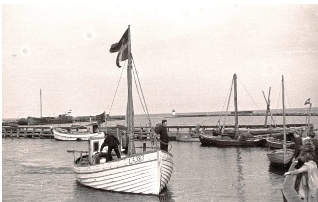
Fiskekutteren Elisabeth sejlede i 1943 ca. 70 danske jøder til Sverige.

I oktober 1943 måtte 7742 danske jøder flygte til Sverige. Historien om flugten er verdensberømt, men færre kender historien om, hvad der skete med de danske jøder ved hjemkomsten til Danmark i 1945. Ligeledes er det sjældent belyst, hvilke konsekvenser flugt og deportation har haft for de mennesker, der flygtede til Sverige eller blev interneret i en nazistisk koncentrationslejr. Hvordan var det at komme hjem igen? Hvordan genetablerede man sig som jøde i Danmark? Og hvordan har man i eftertiden bearbejdet oplevelserne? For selvom man bed tænderne sammen, selvom det gjaldt om at komme videre, og selvom man fik sin tilværelse op at stå igen, var der mange forhindringer og frem for alt meget at bearbejde. Det er netop hjemkomsten efter befrielsen den 4. maj 1945 og den efterfølgende genetablering, dette forløb handler om.