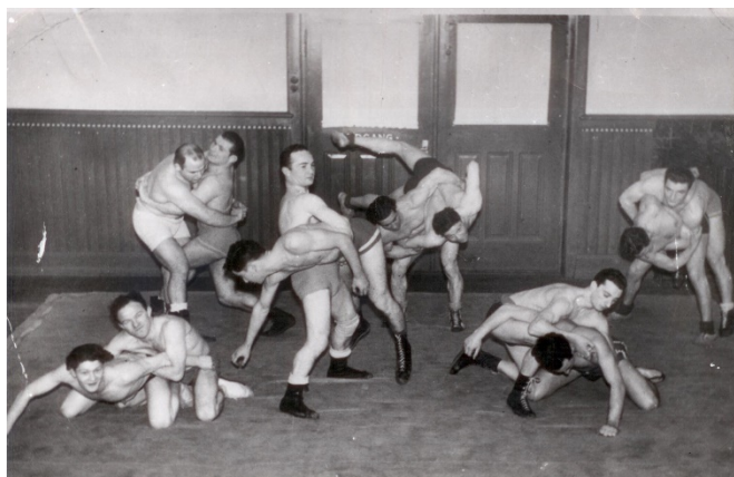
En gruppe brydere fra Hakoah, der poserer for kameraet i forskellige brydepositioner.

Danske stjerner i international sport fra 1933-45 er blevet genstand for en historisk dramatisering sendt på DR i 2021. De senere års forskning afslører et meget intenst samarbejde mellem det officielle idræts-Danmark og det Nazistiske Tyskland. Det satte datidens eliteudøvere i en lang række dilemmaer fra OL i 1936 til krigsudbruddet i 1939 og gennem hele besættelsen af Danmark fra 1940-1945. Skal man følge sine medaljedrømme eller træffe politiske valg, der går på tværs af ens egne idrætsorganisationer? Dilemmaer der fortsat er meget aktuelle.