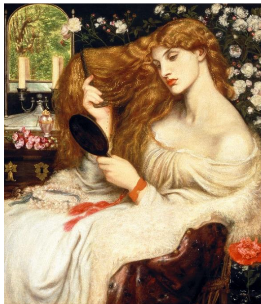
Lady Lilith of Dante Gabriel Rossetti, 1866-68. Delaware Art Museum (USA).