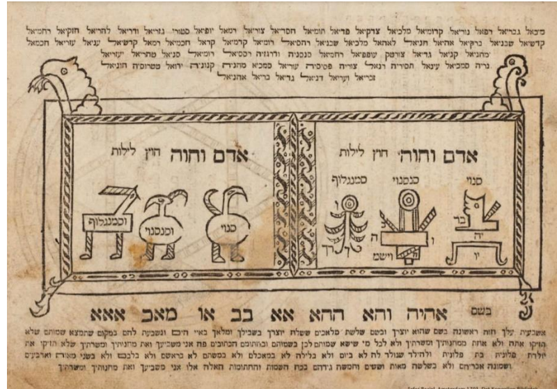
Lilith-amulet fra 1701 af Seifer Raziel. Denne amulet tilhører Det Kongelige Biblioteks samling.

Myten om Lilith blev videreudviklet i de kommende århundreder. Særligt inden for kabbalah (jødisk mystik), hvor både hendes skabelsesberetning og videre færden får nye kapitler. I nogle skrifter bliver hun gift med dødsenglen Samael, og de får tusindvis af dæmonbørn. Den generelle tendens i skrifterne om Lilith er, at hun bliver sat i forbindelse med ondskab i sin reneste form.