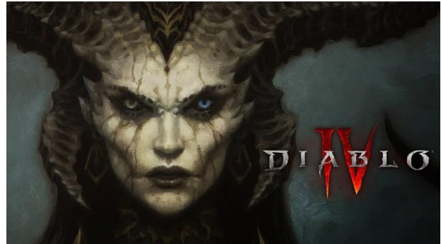
Lilith-figuren i Diablo IV.

Også inden for pc og gaming-kulturen finder vi Lilith. I den populære spilserie Diablo , hvor du som spiller deltager i det godes kamp mod det onde, er Lilith også en del af universet. I 2019, i forbindelse med præ-lancering af Diablo 4 , blev hun præsenteret som spillets primære “antagonist (hovedfjende) eller “final boss” om man vil, i en meget blodig og skrækindjagende video sekvens.