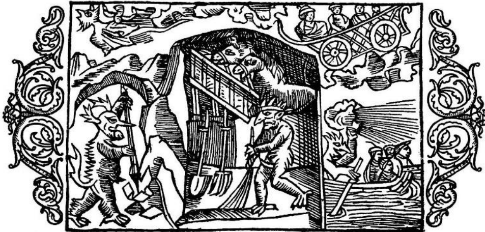
Nissedæmoner af Olaus Magnus 'Carta Marina' fra 1530'erne.