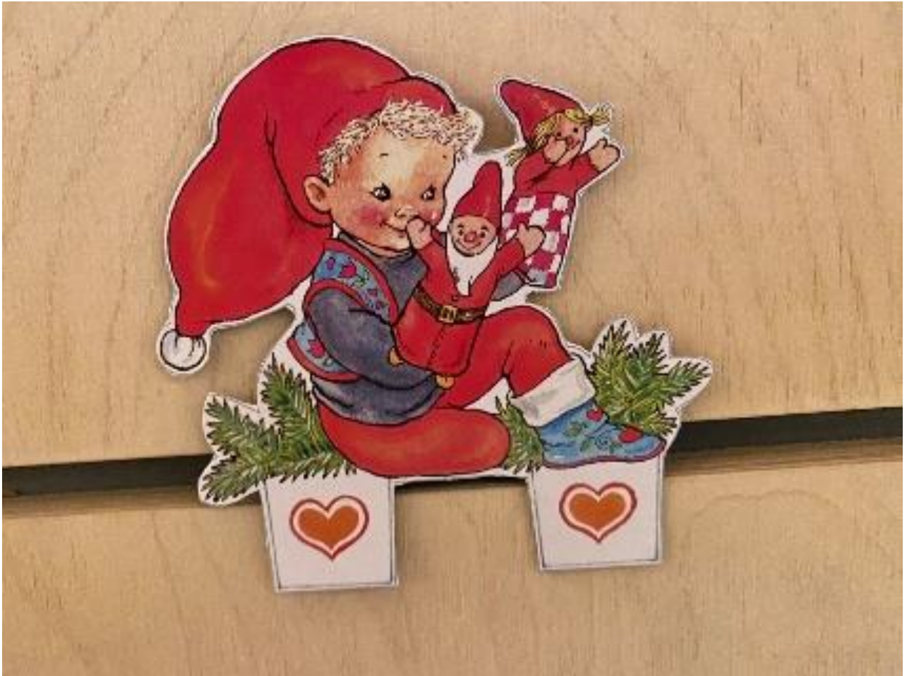
Kravlenisse af Susanna Hartmann