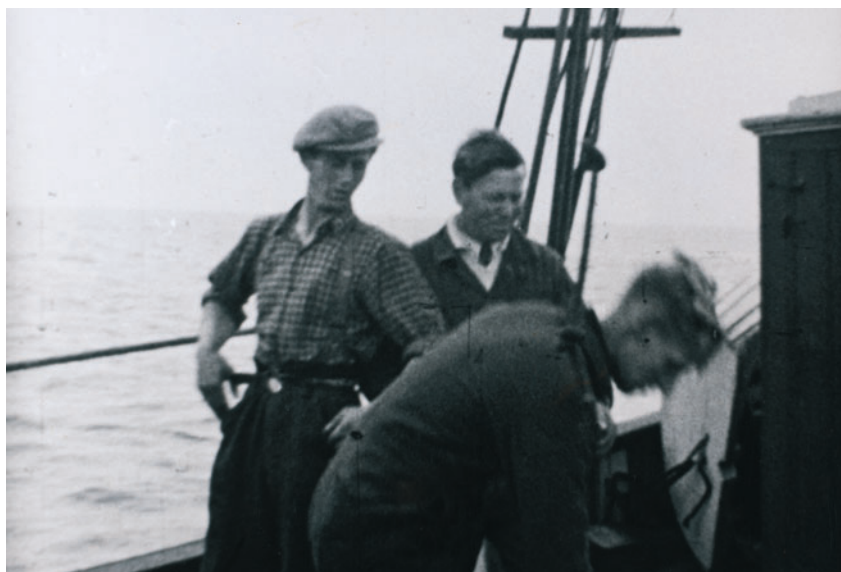
Rekonstruktion fra filmen "Det gælder din Frihed" fra 1946.

for, at tyskerne skulle rette opmærksomhed mod tjenestens virksomhed. Men det kan dog ikke udelukkes, at naboer og bekendtes opførsel var næret af antisemitisme. Generelt skal årsager til den kynisme og grådighed, som kunne gribe om sig i et nabolag ved jødernes flugt, findes i motiver fra egentlig antisemitisme over misundelse til det øgede fristelsespres ved knaphedssituationen.