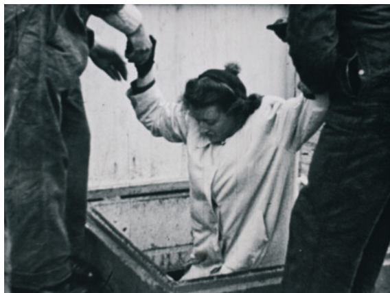
Rekonstruktion fra filmen "Det gælder din Frihed" fra 1946. På Frihedsmuseets hjemmeside, der findes under www.nationalmuseet.dk kan man finde oplysninger om hvilke billeder fra jødernes flugt, der er autentiske og hvilke der er rekonstruktioner.

Det er svært at vurdere, om konfrontationen mellem Socialtjenestens medarbejdere og de implicerede borgere skyldtes mistillid og frygt for myndighedernes indblanding, eller om f.eks. skyldfølelse også kan have spillet en rolle. I en række tilfælde blev Socialtjenestens medarbejdere af gode grunde dog mistænksomme.