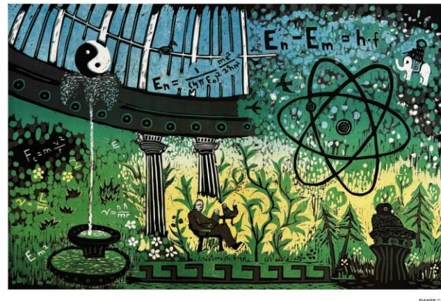
Den nye plakat af træsnittet

100-året for Niels Bohrs modtagelse af Nobelprisen i fysik er blevet markeret ved flere lejligheder, hvor fokus naturligt har været på hans rolle inden for fysikken. Mere ukendt og derfor måske også mindre belyst i den sammenhæng er Niels Bohrs jødiske ophav og forbindelse.